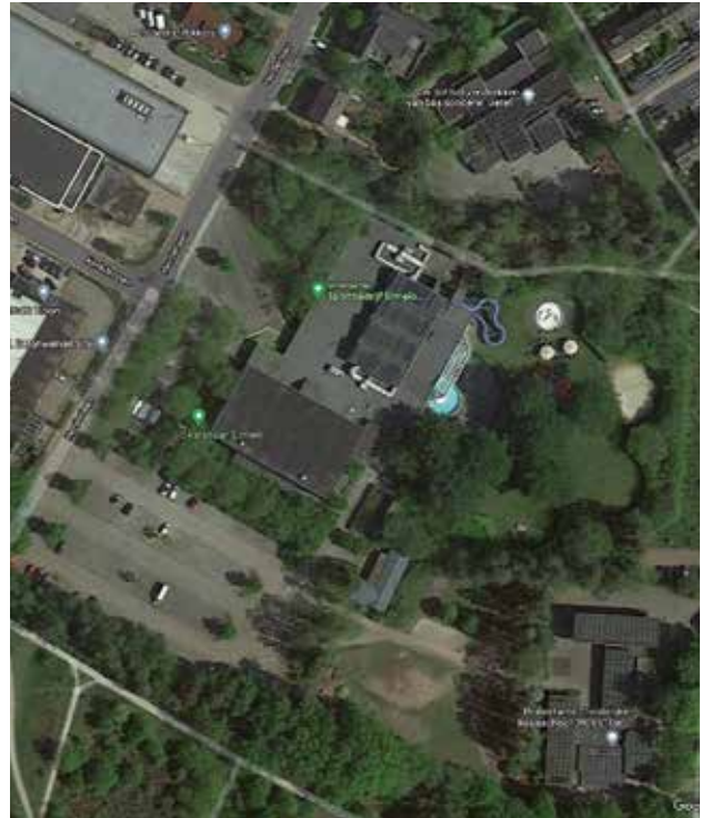
Luchtfoto omgeving De Klokbeker en Augustinus school

Op dit moment (15 februari) wordt er door de SGP nagedacht over een voorstel om een stedenbouwkundige visie voor Speuld op te laten stellen. Dit naar aanleiding van een aantal mogelijke woningbouwinitiatieven. Voor buurtschap Horst wordt namelijk ook gewerkt aan een stedenbouwkundige uitwerking. We hopen hier nog op terug te komen.