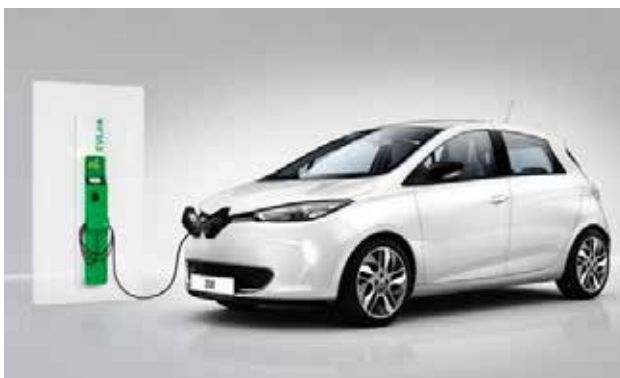
De gemeente Ermelo heeft twee van deze Renault Zoe auto's gekocht voor eigen gebruik en verhuur.

Deze drie pijlers hebben de komende jaren de gezamenlijke aanpak en aandacht nodig om vooruitgang te boeken. Dit betekent het opbouwen van een nieuw energiesysteem. De eerste twee pijlers zijn binnen het huidige denken over energie al aardig ingebed. Door de problemen op het energienetwerk komt er nu steeds meer aandacht voor de derde pijler; de korte en lange termijn opslag van energie.