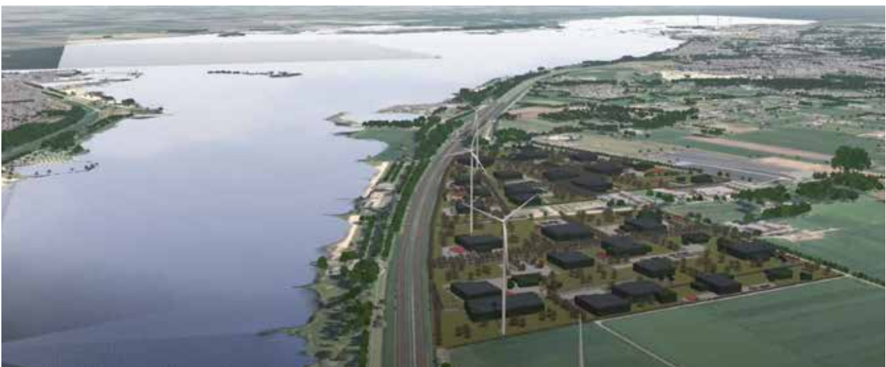
Bedrijvenpark langs A28

Deze visie bevat de ambities van de gemeente Ermelo op het gebied van verkeer en vervoer. Eerder deze raadsperiode hebben inwoners van Ermelo via het Maatschappelijk Raadsprogramma Mobiliteit kunnen aangeven wat zij belangrijke punten vinden die zeker een plek verdienen in