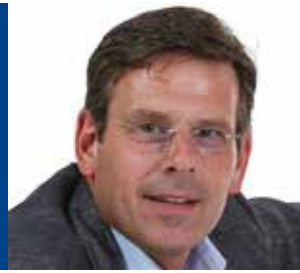
Tekst Peter Hoogendijk