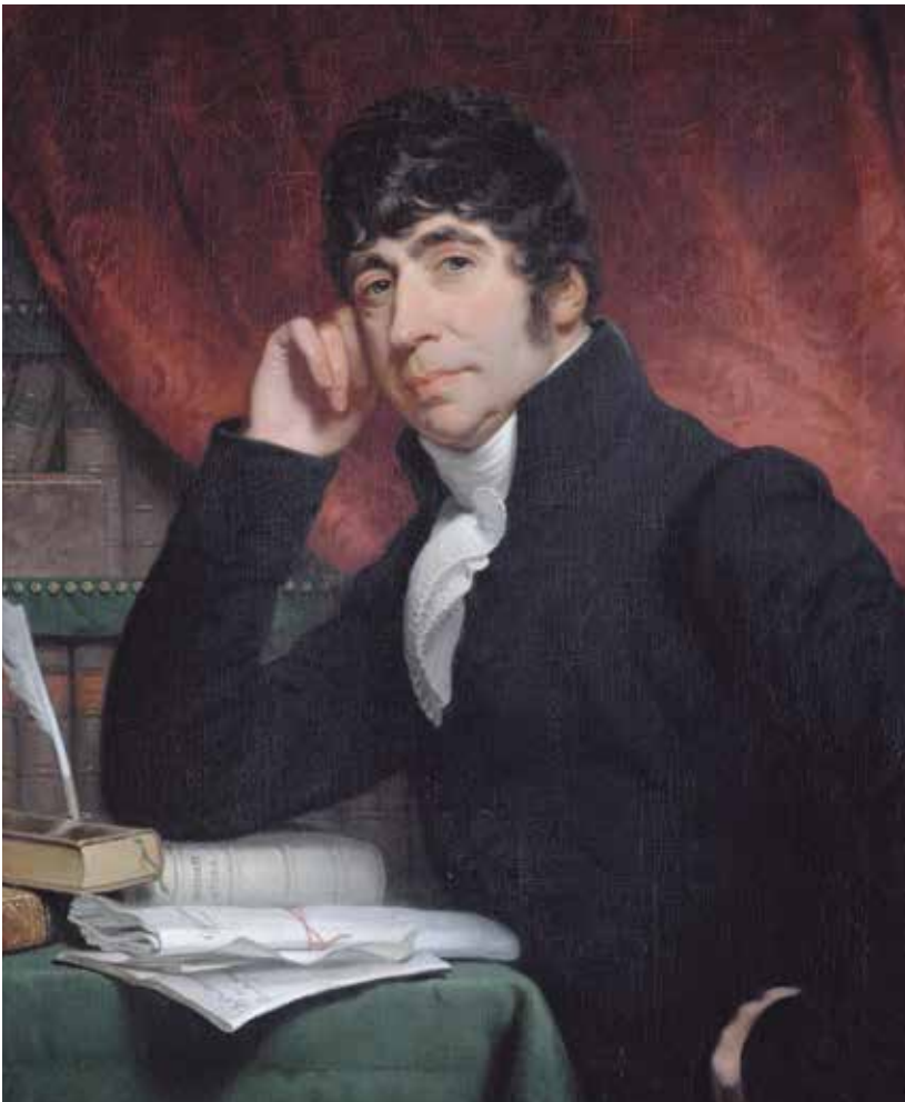
Portret van Willem Bilderdijk, Charles Howard Hodges, Rijksmuseum Amsterdam