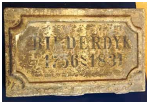
Gevelsteen afkomstig van het pand Garenmarkt 6 in Leiden, waar de familie Bilderdijk enige tijd woonde. Het pand is inmiddels gesloopt en de gevelsteen bevindt zich nu in de bibliotheek aan de Nieuwstraat. Op de steen staat vermeld: 'Bilderdijk 1756-1831'.