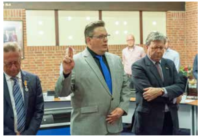
Beëdiging college 2018