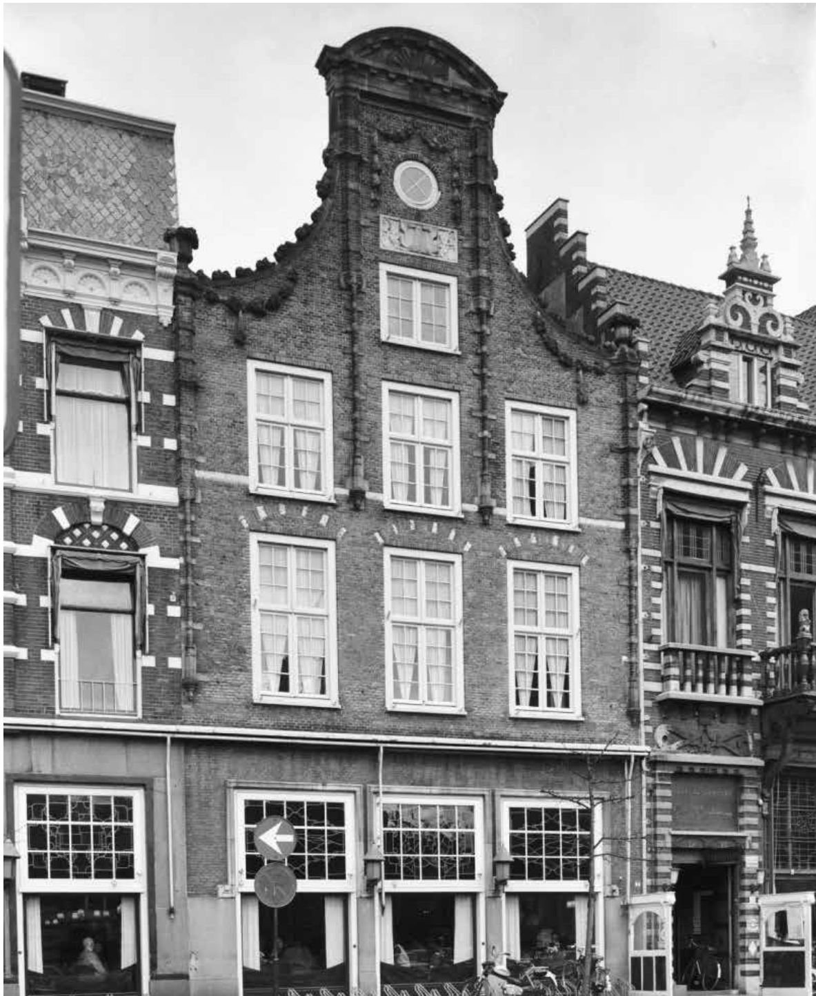
Het huis van Bilderdijk aan de Grote Markt in Haarlem, dat later tot café-restaurant Brinkmann behoorde.

Na de Leidse buskruitramp in 1807, waarbij hun huis onbewoonbaar werd, trok het gezin naar Den Haag en vervolgens naar Amsterdam. Verhuist dan weer naar Leiden;