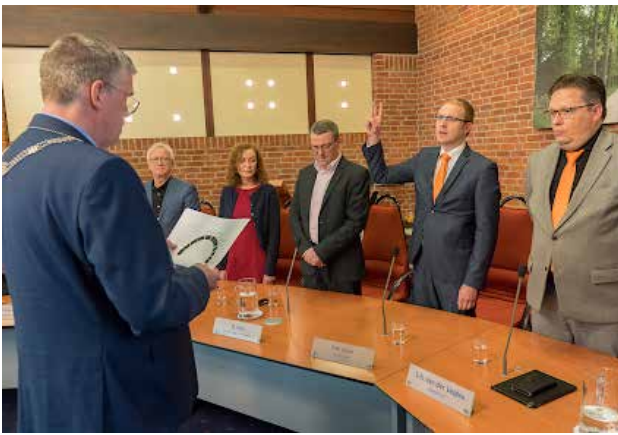
Beëdiging Raadsleden 2018

Aan het eind van deze raadsperiode is het goed om terug te kijken op de afgelopen jaren. Wat is gelukt en wat is niet gelukt?